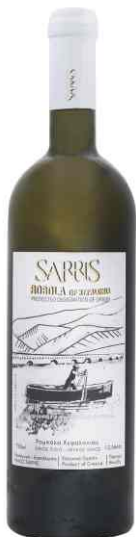
Σαρρής Ρομπόλα λευκός ξηρός Ρομπόλα