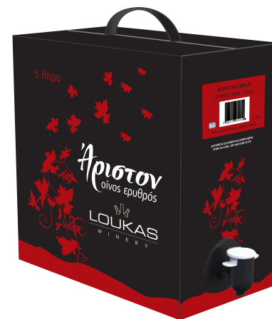
Λουκάς Άριστον ασκός 5L ερυθρός ξηρός Αγιωργίτικο / Merlot

Ρουμπινί ανοιχτό στην όψη, με χαρακτηριστικά αρώματα κόκκινων φρούτων που ισορροπούν με την μαλακή βελούδινη γεύση του.