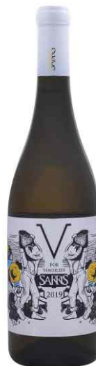
Σαρρής V for Vostilidi λευκός ξηρός Βοστιλίδι Ρομπόλα

Μέτριο λεμονί χρώμα, ντελικάτα αρώματα λεμονιού, grapefruit, κίτρου, ροδάκινου και λευκών λουλουδιών. Γενναίες δόσεις ορυκτότητας εκφράζονται σαν νότες βρεγμένης πέτρας. Στο στόμα έχει εντυπωσιακή δομή, μέτριο προς γεμάτο σώμα, λιπαρή αίσθηση και κοφτερή οξύτητα.