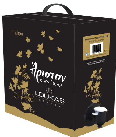
Λουκάς Άριστον ασκός 5L λευκός ξηρός Σαββατιανό / Ροδίτης / Μασχάτο

Ανοιχτόξανθο, λαμπερό στην όψη με διακριτικά αρώματα σπειροειδών που συνδυάζονται αρμονικά με την φρωτώδη γεύση του.