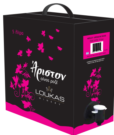
Λουκάς Άριστον ασκός 5L ροζέ ξηρός Merlot / Grenache Rouge

Ανοιχτόξανθο, λαμπερό στην όψη με διακριτικά αρώματα σπειροειδών που συνδυάζονται αρμονικά με την φρωτώδη γεύση του.