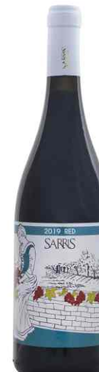
Σαρρής Ερυθρός ερυθρός ξηρός Malbec

Έχει απαλό λεμονί χρώμα, κομψά αρώματα αχλαδιού, πράσινου μήλου, κίτρου, μοσχολέμονου, φλούδας λεμονιού και λεμονόχορτου, ενώ ένας υπέροχος mineral χαρακτήρας βρεγμένης πέτρας χαρίζει πολυπλοκότητα. Μέτριο προς πλούσιο στόμα, έντονο, συμπυκνωμένο, με υψηλή, αναζωογονητική οξύτητα.