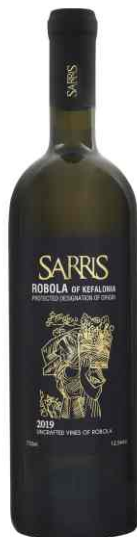
Σαρρής Ρομπόλα Ungrafted Vines, λευκός ξηρός Ρομπόλα

Έχει απαλό λεμονί χρώμα, κομψά αρώματα αχλαδιού, πράσινου μήλου, κίτρου, μοσχολέμονου, φλούδας λεμονιού και λεμονόχορτο, ενώ ένας υπέροχος mineral χαρακτήρας βρεγμένης πέτρας χαρίζει πολυπλοκότητα. Μέτριο προς πλούσιο στόμα, έντονο, συμπυκνωμένο, με υψηλή, αναζωογονητική οξύτητα.